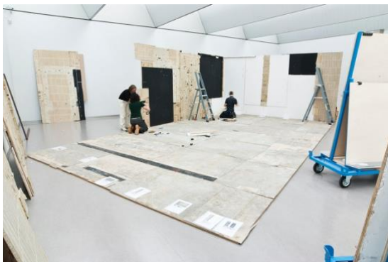
Tijdens het installeren van Franz West's installatie Clamp (1995) in 2012, met de wanden behangen met pagina's uit oude telefoongidsen waaraan nu een deel van de geschiedenis van het werk is af te lezen.

Voor de tentoonstellingsmaker kan zich het volgende dilemma voordoen. Dient het werk bij opstelling altijd in zijn geheel te worden getoond, of kan worden volstaan met een selectie van de delen, en zo ja, welke? Bij een eerste opstelling was één de gebruiksfuncties het telefoneren met een vaste telefoon. Bij latere opstellingen werd deze telefoon niet meer opgesteld. Was dit op basis van een directe aanwijzing van de kunstenaar, of ingegeven door technologische ontwikkeling – of beide?