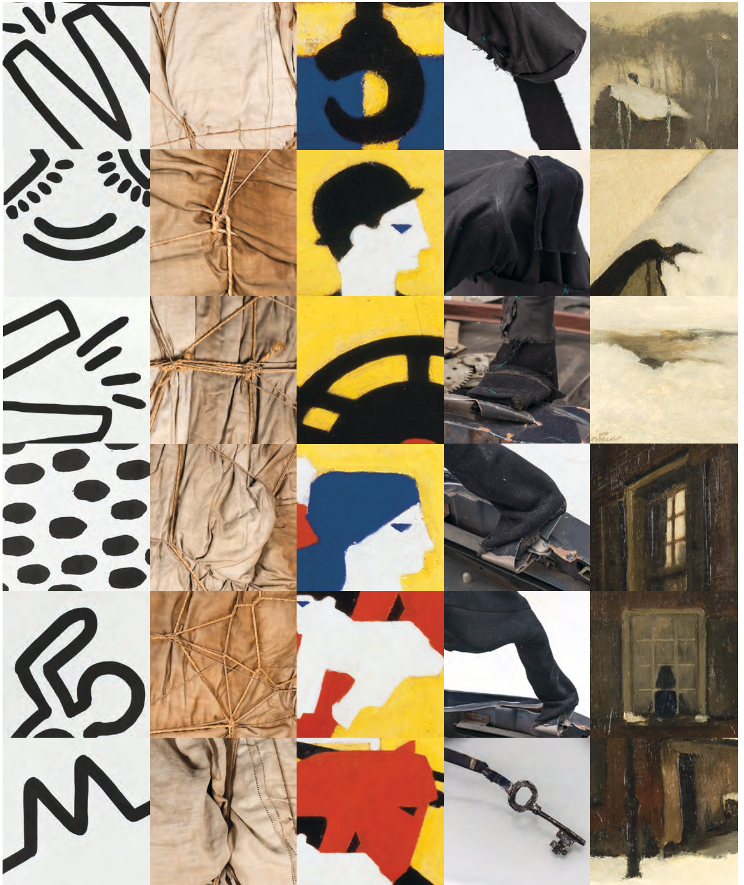
Keith Haring Untitled , 1981